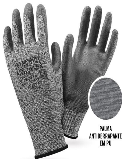
PALMA ANTIDERRAPANTE EM PU